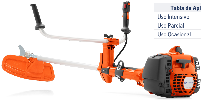
Tabla de Aplicación

Husqvarna 555RXT es una desbrozadora muy potente, desarrollada para trabajar a tiempo completo en condiciones difíciles. El motor X-Torq® proporciona potencia, aceleración rápida y excelente economía de combustible. El eje largo y el engranaje cónico con un ángulo de 35 grados simplifican los barridos más amplios. Vibraciones muy bajas gracias a LowVib®. Entregado con arnés Balance XT.