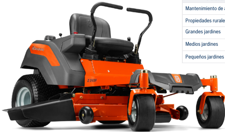
Tabla de Aplicación